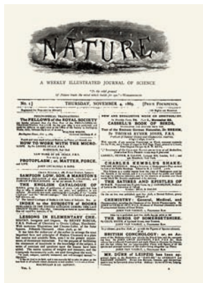
創刊号 1869年(明治2年) 11月4日号

1869年（明治2年）の創刊時に Nature は下記のような「創刊の趣旨」を掲載しました。この趣旨は、144年たった現在もなんら変わることなく生き続けています。また、創刊号の表紙には、19世紀の自然派詩人ワーズワース（1770～1850）のソネット第34番の一節が引用されています。